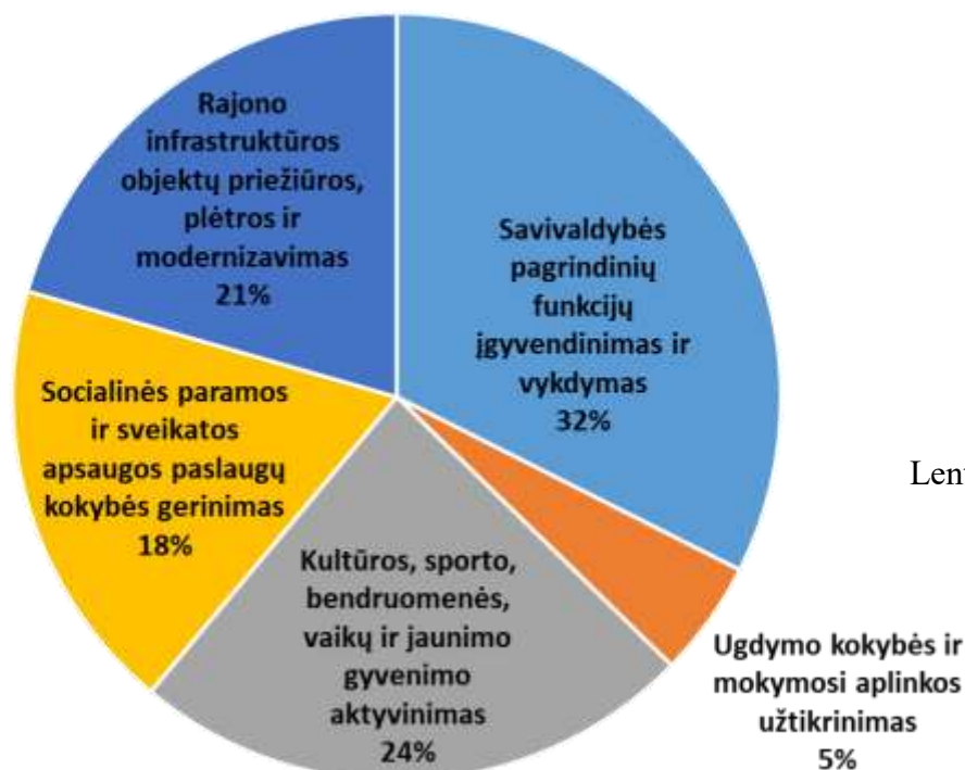
Lentelė Nr. 2