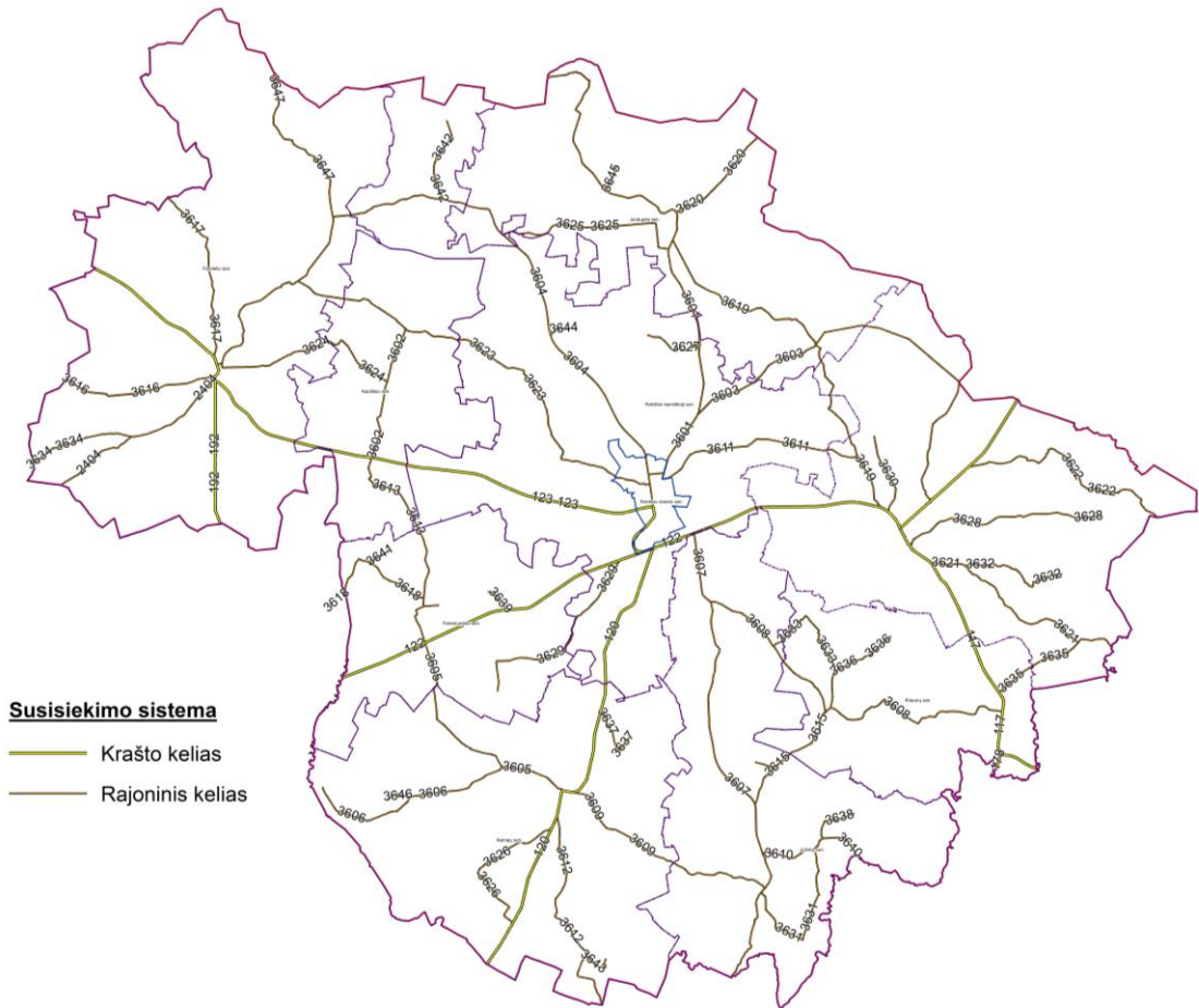
2.2 pav. Rokiškio rajono krašto ir rajoninių kelių pasiskirstymas