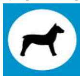
Zona, skirta lankytis su gyvūnais