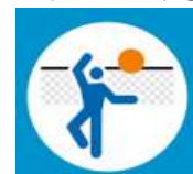
Aktyvaus poilsio zona