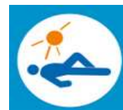
Pasyvaus poilsio zona