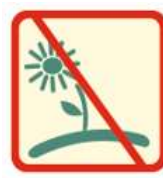
Skinti ar naikinti saugomų rūšių augalus