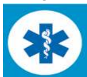
Pirmoji medicinos pagalba