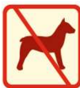
Lankytis su gyvūnais