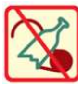
Vartoti alkoholinius gėrimus