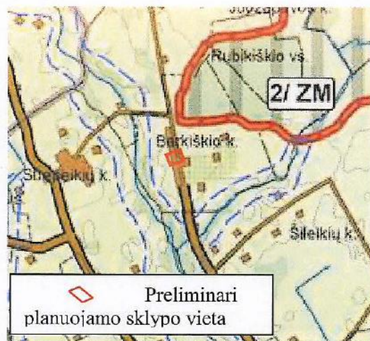
2 paveikslas. Ištrauka iš bendrojo plano ties planuojama teritorija

Pagal Rokiškio miesto savivaldybės dalies bendrąjį planą (patvirtintas 2008 m. birželio 27 d. Rokiškio rajono savivaldybės tarybos sprendimu Nr. TS-6.109), planuojama teritorija patenka į