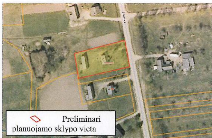
3 paveikslas. Planuojamo ir gretimų sklypų ribos

Informacinis skelbimas internetinėje erdvėje paskelbtas Rokiškio rajono savivaldybės administracijos internetiniame tinklalapyje adresu http://rokiskis.lt/lt/teritoriju-planavimas/detalieji-planai.html , Rokiškio rajono savivaldybės ribose platiname laikraštyje „Gimtasis Rokiškis“, pastatytas laikinasis informacinis stendas.