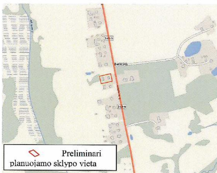
1 paveikslas. Planuojamos teritorijos padėtis vietovėje

1.3 PLANUOJAMA TERITORIJA: žemės sklypas, esantis Rokiškio rajono savivaldybėje, Obelių seniūnijoje, Barkišio kaime, Šilaikių g. 18 (žr. 1 pav.). Planuojamas plotas ~ 0,20 ha.