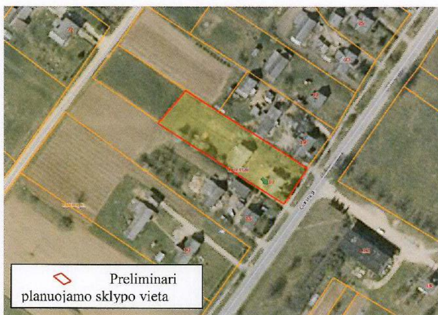
3 paveikslas. Planuojamo ir gretimų sklypų ribos

Visuomenė informuota ir supažindinta su žemės sklypo detaliuoju planu, vadovaujantis Visuomenės informavimo ir dalyvavimo teritorijų planavimo procese nuostatais, patvirtintais Lietuvos Respublikos Vyriausybės nutarimu.