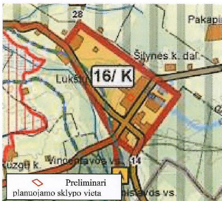
2 paveikslas. Ištrauka iš bendrojo plano ties planuojama teritorija

kapinės ir 0,5 km atstumu Rubikių miškas. Esama teritorija patenka į gamtinio karkaso nacionalinės ir regioninės svarbos migracijos koridorių.