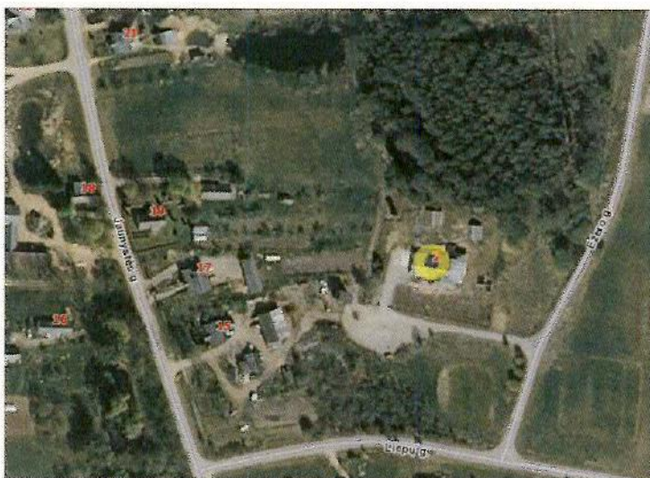
1 paveikslas. Planuojamos teritorijos padėtis vietovėje

1.3 PLANUOJAMA TERITORIJA: žemės sklypas, esantis Rokiškio rajono savivaldybėje, Kamajų seniūnijoje, Aukštakalnių k., Ežero g. 2 (žr. 1 pav.). Planuojama teritorija ~ 0,4 ha. Įvertinus esamus objektus, gretimybes, suprojektuotas 0,4027 ha ploto žemės sklypas.