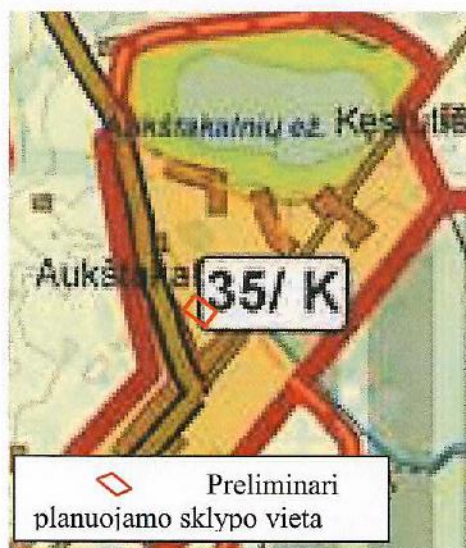
2 paveikslas. Ištrauka iš bendrojo plano ties planuojama teritorija

Urbanistinė situacija. Planuojama teritorija yra centinėje Aukštakalnių kaimo dalyje (žr. 1 pav.), pagal 2.21 punkte nurodytą planavimo dokumentą priskiriama kitos paskirties žemės prioritetui (žr. 2 pav.). Planuojamo sklypo vakarinėje pusėje rajoninis kelias Varliai – Aukštakalniai (3637), šiaurinėje pusėje, 0,5 km atstumu Aukštakalnių ežeras.