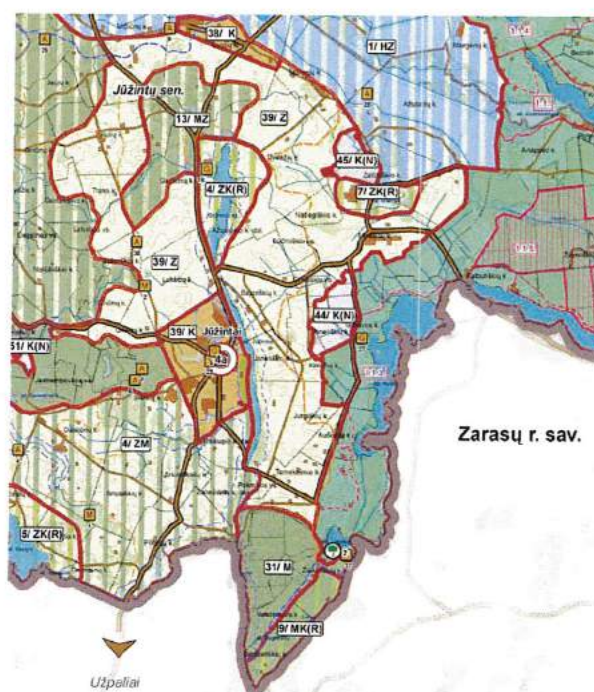
3.1.1. pav. Rokiškio rajono savivaldybės teritorijos bendrasis planas, Žemės naudojimo, tvarkymo ir apsaugos reglamentų brėžinys.

Formuojamas žemės sklypas yra Jūžintų miestelyje, Ežero gavėje. Planuojamoje teritorijoje galioja Rokiškio rajono savivaldybės teritorijos bendrojo plano sprendiniai (3.1.1. pav.).