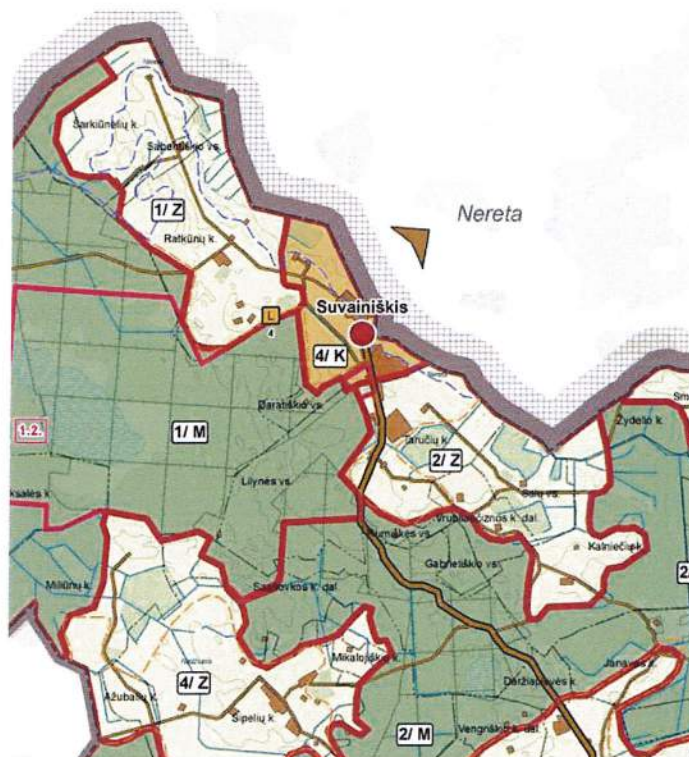
3.1.1. pav. Rokiškio rajono savivaldybės teritorijos bendrasis planas, Žemės naudojimo, tvarkymo ir apsaugos reglamentų brėžinys.

Planuojamoje teritorijoje galioja Rokiškio rajono savivaldybės teritorijos bendrojo plano sprendiniai (3.1.1. pav.). Formuojamas žemės sklypas esamoms kapinėms Suvainišio mstl., nuo miestelio centro į šiaurę nutolęs apie 1,5 km.