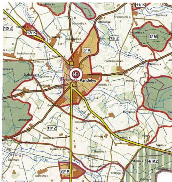
3.1.1. pav. Rokiškio rajono savivaldybės teritorijos bendrasis planas, Žemės naudojimo, tvarkymo ir apsaugos reglamentų brėžinys.

Planuojamoje teritorijoje galioja Rokiškio rajono savivaldybės teritorijos bendrojo plano sprendiniai (3.1.1. pav.). Planuojama teritorija yra Pandėlio miesto centrinėje dalyje, Puodžialaukės gatvėje, Nr. 8.