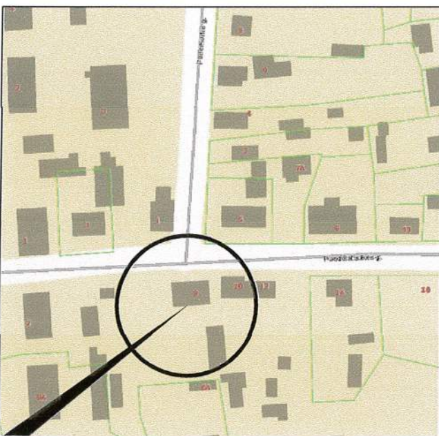
Planuojamos teritorijos situacijos schema (www.regia.lt)