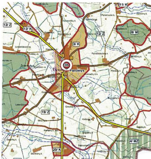
3.1.1. pav. Rokiškio rajono savivaldybės teritorijos bendrasis planas, Žemės naudojimo, tvarkymo ir apsaugos reglamentų brėžinys.

Planuojamoje teritorijoje galioja Rokiškio rajono savivaldybės teritorijos bendrojo plano sprendiniai (3.1.1. pav.). Planuojama teritorija yra prie krašto kelio Nr.123 Birai-Pandėlys-Rokiškis, Pandėlio miesto pietinėje dalyje.