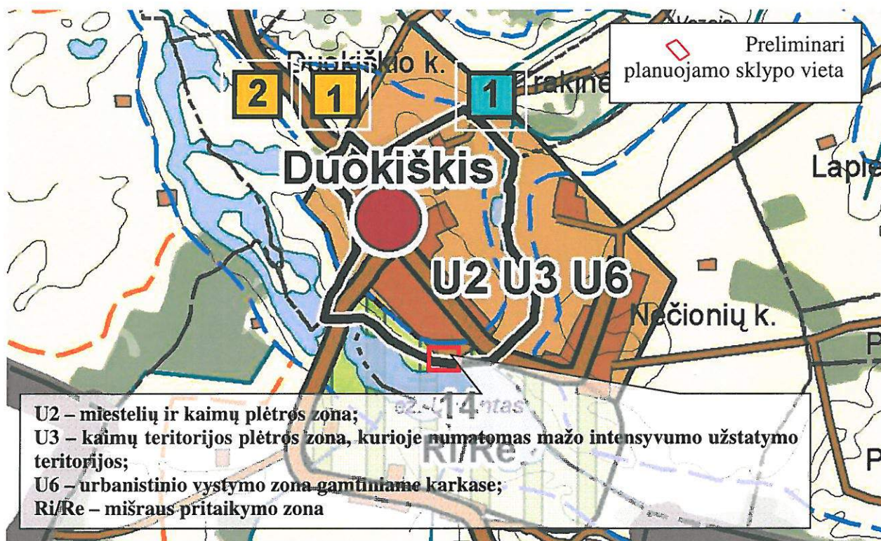
2 paveikslas. Ištrauka iš Rokiškio rajono savivaldybės bendrojo plano ties planuojama teritorija

Pagal bendrąjį planą planuojama teritorija patenka į: