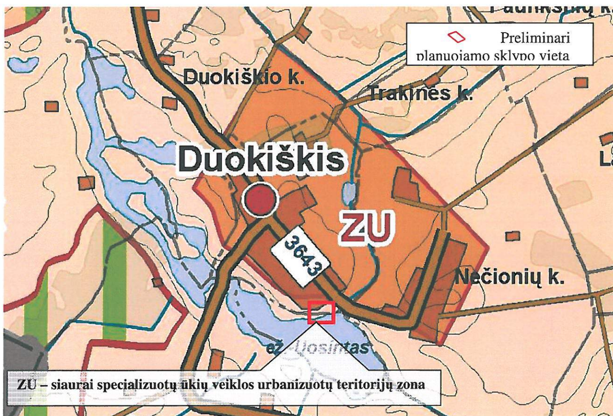
3 paveikslas. Ištrauka iš Rokiškio rajono savivaldybės bendrojo plano

Planuojamos teritorijos gretimybės. Pagal planuojamos teritorijos išsidėstymą ir plėtrą bei vadovaujantis Nekilnojamojo turto registro centrinio banko apibrėžtomis artimiausių suformuotų sklypų ribomis, nustatytos šios planuojamo sklypo gretimybės (žr. 4 pav.):