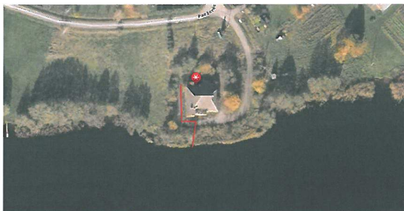
Schema Nr. 1

Gaisrinė sauga. Priešgaisriniai atstumai tarp pastatų numatomi pagal gaisrinės saugos pagrindinių reikalavimų 6 lentelę. Bendroju atveju planuojamų pastatų minimalus atsparumo ugniai laipsnis nustatomas – I, išlaikant atstumus tarp pastatų priklausomai nuo pastatų atsparumo ugniai. Techninio projekto rengimo metu turi būti tikslinamas pastatų atsparumo ugniai laipsnis. Projekte užtikrinamas priešgaisrinių automobilių privažiavimas prie kiekvieno projektuojamo sklypo. Gaisriniais automobiliams skirtų pravažiavimų aukštis turi būti ne mažesnis kaip 4,25 m, o plotis ne mažesnis kaip 3,5 m (visais atvejais – iki išsikišusių konstrukcijų). Gaisro plitimas į gretimus pastatus ribojamas užtikrinant saugius atstumus tarp pastatų lauko sienų.