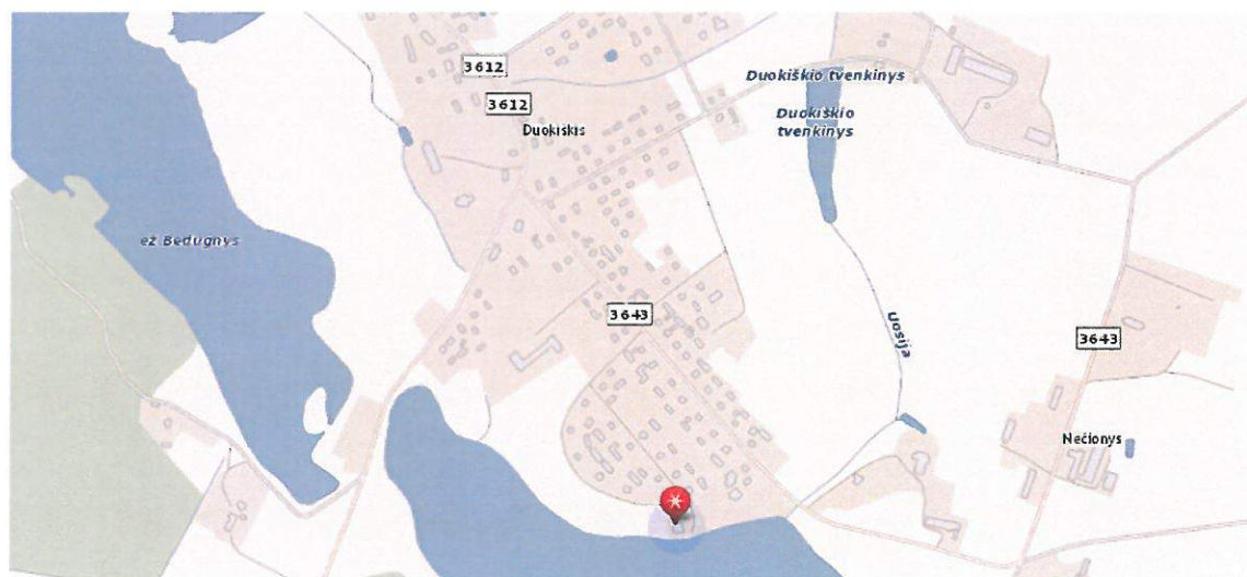
1 paveikslas. Planuojamos teritorijos padėtis vietovėje

1.3 PLANUOJAMA TERITORIJA: žemės sklypas, esantis Paežerės g. 3 (esanti pirtis), Duokiškio miestelyje, Kamajų seniūnijoje (žr. 1 pav.). Planuojamas sklypo plotas – 0,2 ha.