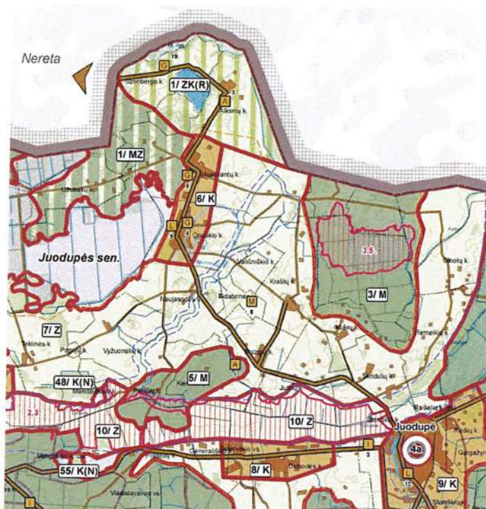
3.1.1. pav. Rokiškio rajono savivaldybės teritorijos bendrasis planas, Žemės naudojimo, tvarkymo ir apsaugos reglamentų brėžinys.

Planuojamoje teritorijoje galioja Rokiškio rajono savivaldybės teritorijos bendrojo plano sprendiniai (3.1.1. pav.).