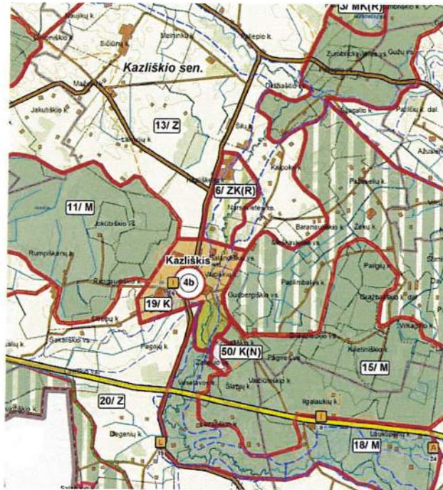
3.1.1. pav. Rokiškio rajono savivaldybės teritorijos bendrasis planas, Žemės naudojimo, tvarkymo ir apsaugos reglamentų brėžinys.

Planuojamoje teritorijoje galioja Rokiškio rajono savivaldybės teritorijos bendrojo plano sprendiniai (3.1.1. pav.). Planuojama teritorija nutolusi nuo Kazliškio k. į šiaurę apie 2,2 km, yra Kazliškėlio kaime, šalia rajoninio kelio Nr. 3602.