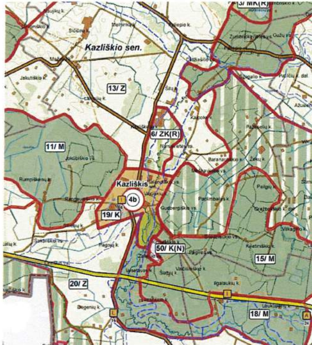
3.1.1. pav. Rokiškio rajono savivaldybės teritorijos bendrasis planas, Žemės naudojimo, tvarkymo ir apsaugos reglamentų brėžinys.

Planuojamoje teritorijoje galioja Rokiškio rajono savivaldybės teritorijos bendrojo plano sprendiniai (3.1.1. pav.). Planuojama teritorija nutolusi nuo Kazliškio k. į šiaurę apie 2,2 km, yra Kazliškėlio kaime, šalia rajoninio kelio Nr. 3602.