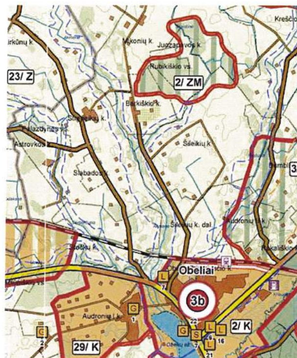
3.1.1. pav. Rokiškio rajono savivaldybės teritorijos bendrasis planas, Žemės naudojimo, tvarkymo ir apsaugos reglamentų brėžinys.

Planuojamoje teritorijoje galioja Rokiškio rajono savivaldybės teritorijos bendrojo plano sprendiniai (3.1.1. pav.). Formuojamas žemės sklypas Šilaikių g. 14, Barkišio k., Obelių sen., Rokiškio r. sav., šalia rajoninio kelio Nr. 3630, iki Obelių miesto apie 5 km.