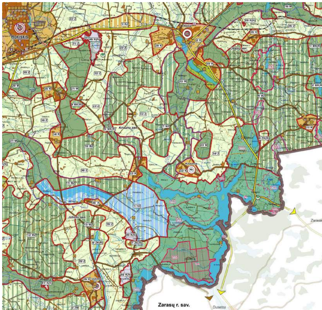
3.1.1. pav. Rokiškio rajono savivaldybės teritorijos bendrasis planas, Žemės naudojimo, tvarkymo ir apsaugos reglamentų brėžinys.

Planuojamoje teritorijoje galioja Rokiškio rajono savivaldybės teritorijos bendrojo plano sprendiniai (3.1.1. pav.). Planuojamas žemės sklypas esamoms kapinėms yra Kriugiškio kaime, Kriaunų sen., Rokiškio r. sav. Kaimo kapinės pasiekiamos vietiniu, žvyruotu keliuku.